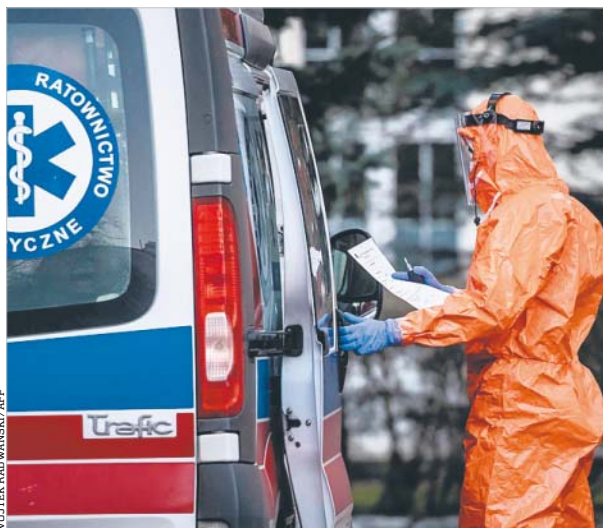
Pandemia koronawirusa kompletnie zmieniła biznesowy krajobraz

Przedsiębiorstwa mają sporo wątpliwości i pytań w związku z nowym formatem sprawozdań. Zgodnie z informacjami upublicznionymi przez Komisję Nadzoru Finansowego, do przekazywania raportów rocznych w nowym