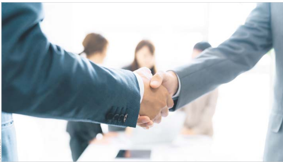
Na rynku usług audytorskich można spodziewać się dalszych fuzji i przejęć

- Doświadczenie w największych firmach audytorskich i doradczych z wielkiej czwórki, ale także po drugiej stronie, w tzw. biznesie, w pionach finansowych dużych korporacji, pokazało nam, jak dużą zaletą dla krajowych firm audytorskich jest sieciowość. Działanie w ramach sieci to możliwość synergii zasobów, wymiany